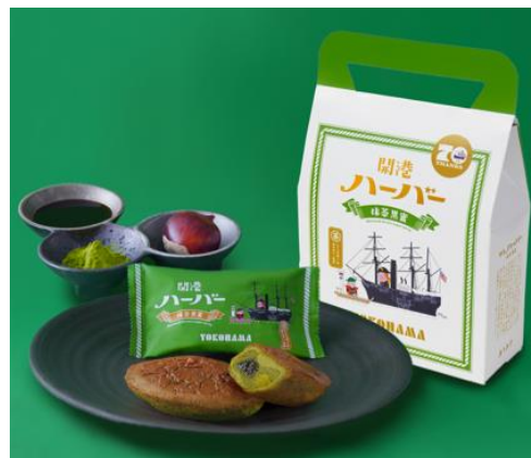
【開港ハーバー・抹茶黒蜜】

今回開発した「万丈の蒼」専用の茶畑も、ここにあります。面積は1.3反で、坪数にすると390坪。とても蒼みのある美しい茶畑が一面に広がっています。こちらでは茶園に棚を建て、黒い遮光資材で被覆し、陽の光を遮る棚がけ被覆栽培を採用。これによりお茶の旨味が引き出され、蒼みのある高品質なお茶が作られます。開港ハーバーの素材として、焼き上げても蒼が鮮やかで薫り高い、最適な最高級抹茶が完成しました。