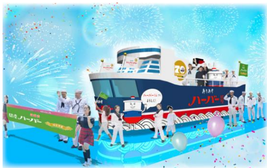
【フロート ありあけハーバー号イメージパース】

2024年5月3日(金・祝)に開催される「ザよこはまパレード」に、ありあけ初のフロート「ハーバー一号」が初参加します。同日にありあけ直営店にて先行発売する本商品のPRをするとともに、ありあけ初のマスコットキャラクター「ハーバーくん」の着ぐるみも初公開！フロートに搭乗し、皆様にご挨拶します。