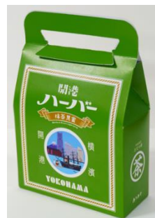
【パッケージイラスト】