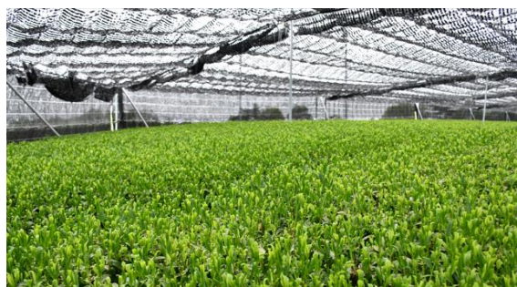
【万丈の蒼 開港ハーバー専用茶畑】