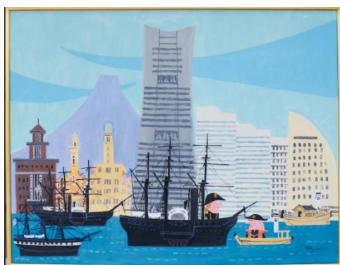
【ペルリ提督とアンクル代官】