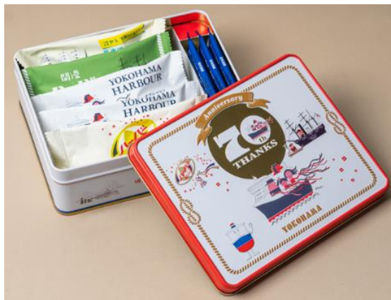
【横濱ハーバー70周年ありがとう記念缶】

本商品はハーバー誕生 70周年を記念し、エンボス仕上げの特別な缶に人気の5種を詰め合わせた特別版です。限定復活&昔の味わい・パッケージを再現した「復刻ハーバー」、定番の「横濱ハーバー ダブルマロン」、6月に新登場のオリジナルブレンド抹茶“万丈の蒼”を使用した「開港ハーバー 抹茶黒蜜」、特製アイスクリン餡に国産のゆずを組合せ、より夏にぴったりの爽やかな味わいに仕上げた夏季限定「馬車道アイスクリンハーバー ゆず」、さっくりと焼き上げたバター風味の香ばしいサブレ「横濱ベイブリッジサブレ」。記念缶には、70周年の記念ロゴと懐かしの気球のデザイン、柳原良平氏のイラスト、そしてこの春に誕生したありあけ初のマスコットキャラクター「ハーバーくん」をあしらいました。70年間に思いを馳せながら、横濱ハーバー定番の様々なお菓子の食べ比べを、ぜひお楽しみください。