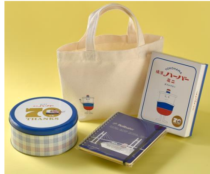
【ありあけオンラインショップ 祝！70周年記念！ 人気のトートバッグセット】