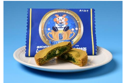
【横浜 DeNA ベイスターズムーンガレット☆たまくす抹茶】