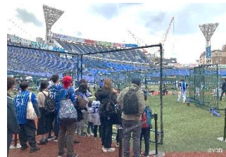
【グラウンド練習見学】