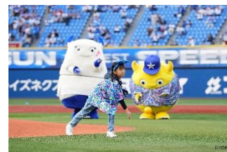
【スピードガンコンテスト】