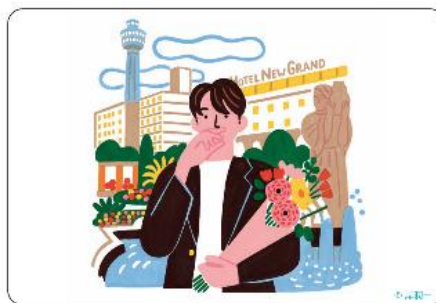
ポストカードデザイン