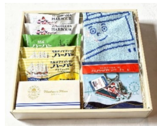
グッズ入りギフト B