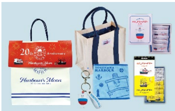
ハーバズムーン 20 周年記念セット