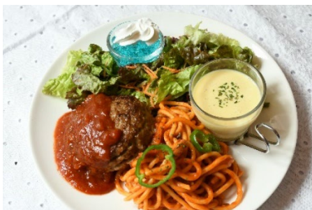
横濱ハイカラプレート

港横浜の夕焼けの景色をイメージしたパルフェ。YOKOHAMA ブルーが一段と輝きます。香り豊かな白桃果肉とバニリアイスcream、爽やかなラムネシャーベットと紅茶ゼリーのマリアージュをお楽しみください。※ミニハーバー付き(提供時間 14:00~ラストオーダーまで)