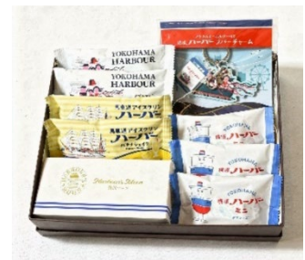
グッズ入りギフト A

横濱ハーバーダブルマロン×2個、開港ハーバー抹茶黒蜜×1個、馬車道アイスクリンハーバーバナナシェイク×2個、贅沢マロン×1個、ハーバーくんジャガードタオル青(グッズ)、横濱ハーバーラバーチャーム(グッズ)