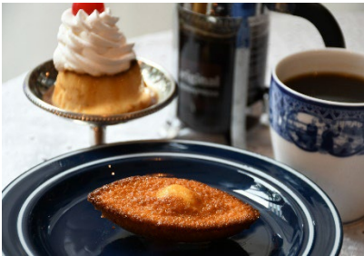
王道プリンマドレーヌ

新たに開発したもちもち生地の中に、ダブルマロン餡とカスタードクリームをブレンドしたクリームを閉じ込め、優しく焼き上げました。