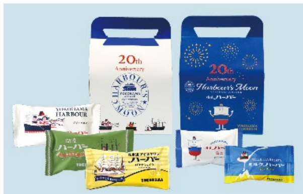
ハーバズムーン 20 周年オリジナルアソート

横濱ハーバーミニダブルマロン 5 個入、黒船ハーバーアソートダブルマロン&ペリーのれもねーど 8 個入、ハーバーくんジャガードタオル、トートバッグ、立体ラバーキーホルダー（各 1 個） ※約 6,700 円（税込）相当の詰合せ