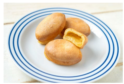
横濱ハーバーはまっこもち クリーミー