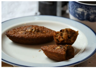
開港珈琲マドレーヌ